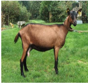
Paquerette, Fleurette ou Mirtylle ?

À partir du mardi 6 avril, 3 chèvres seront introduites dans l'enceinte du collège, plus précisément, elles seront installées au niveau du potager près des habitations de fonction, dans un enclos.